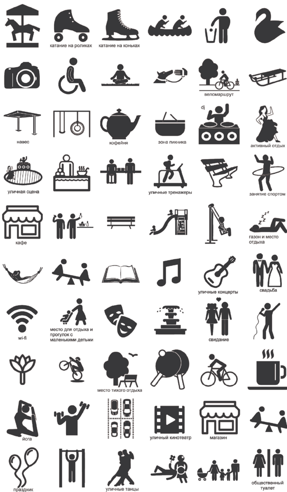
Пример набора значков для проведения дизайн-игры, используемых для работы с картой